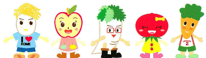
平川市食育推進キャラクター「ひらかわ元気ファミリー」