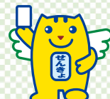
明るい選挙キャラクター 選挙のめいすいくん