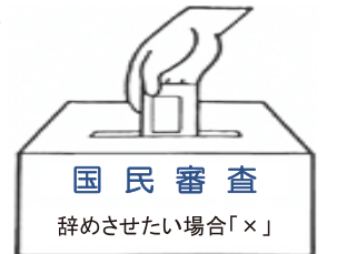
うぐいす色の投票用紙