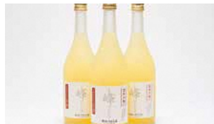
株式会社 釈迦のりんご園