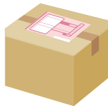
「お礼の品」がもらえる！

※ただし、全額控除される寄附上限額は、収入や家族構成等により異なります。詳しくは総務省ふるさと納税ポータルサイト（税金の控除について）をご参照ください。