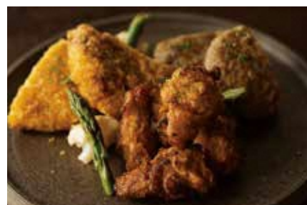
肉の豚金 葛西精肉店

ひらかわ牛使用のハンバーグ&メンチカツ・シャモロック唐揚げ 冷凍 計約1.3kg