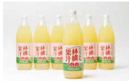
広船アップルクラブ

親子4代で100年以上続く農家の厳選されたりんごだけを絞ったオリジナルブレンドジュースです。