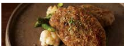
肉の豚金 葛西精肉店