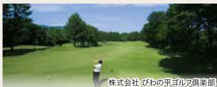
株式会社 びわの平ゴルフ倶楽部