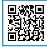
セゾンのふるさと納税