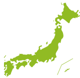
生まれ故郷でなくてもOK！