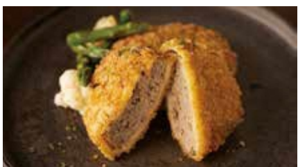
肉の豚金 葛西精肉店