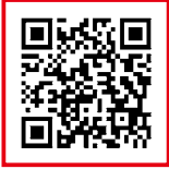
楽天ふるさと納税