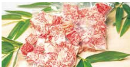
肉の豚金 葛西精肉店