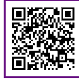
ふるさと納税百選