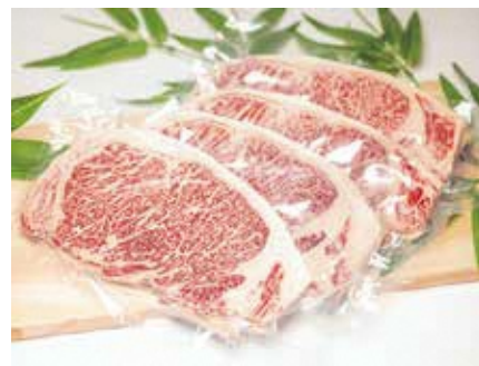
肉の豚金 葛西精肉店