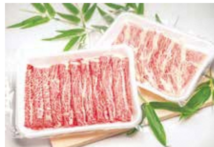
肉の豚金 葛西精肉店