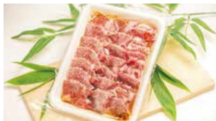
肉の豚金 葛西精肉店