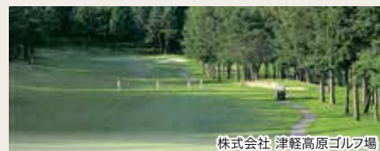
株式会社 津軽高原ゴルフ場

十和田八幡平国立公園に隣接し、自然の地形を活かした谷越えのホールのある林間コースです。GPSナビ付き乗用カートはフェアウェイに乗入れもでき、女性もシニアの方も楽にラウンドができます。