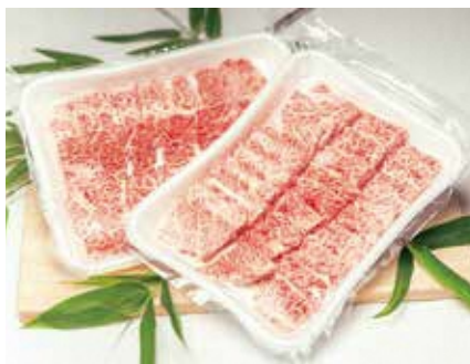
肉の豚金 葛西精肉店