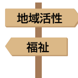
使い道を指定できる！