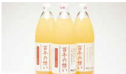
株式会社 釈迦のりんご園