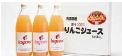
株式会社 那由多のりんご園

最高級フルーツ店銀座千足屋の看板商品です。5品種のりんごを皮ごと絞った深みのあるジュースです。