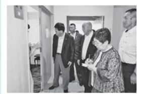
大村市 市民交流プラザ「プラザおおむら」