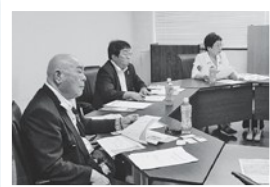
荒尾市 エネルギーマネジメント事業