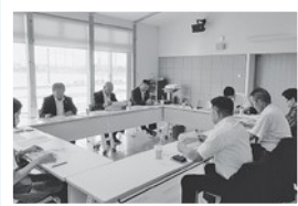
大川市 子育て支援総合施設モッカランド

菊池市の関係人口創出のための市の取組については、歴史文化による地域活性化について研修し、関係人口増加による産業分野の活性化や新たな魅力発見、観光コンテンツの充実に向け意見交換しました。