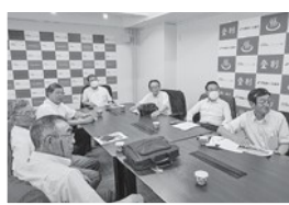
登別市 低速電動バス「オニスロ」