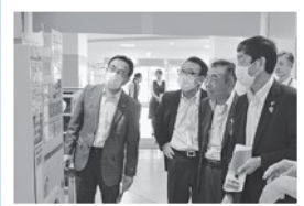
室蘭市 生涯学習センター「きらん」