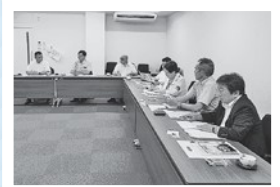
菊池市 関係人口創出