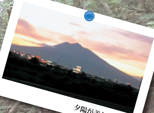
夕陽が美しい岩木山