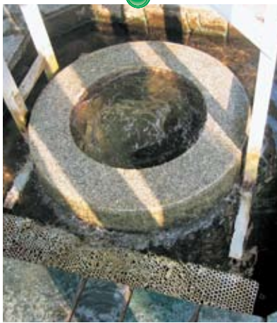
日本名水百選・渾神の清水(いがみのしっこ)