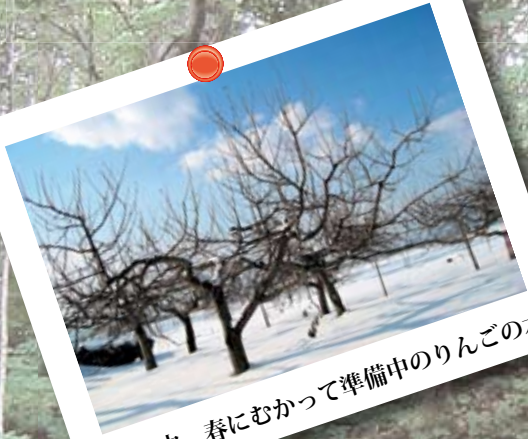
雪の中、春にむかって準備中のりんごの木