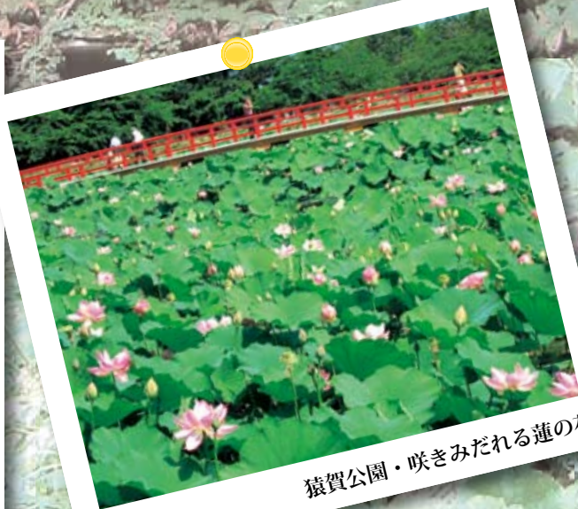
猿賀公園・咲きみだれる蓮の花