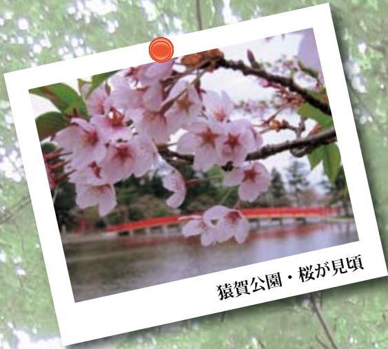
猿賀公園・桜が見頃