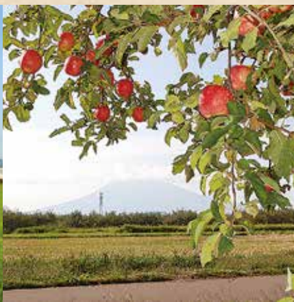
りんご畑と岩木山