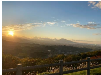
志賀坊森林公園（眺望）