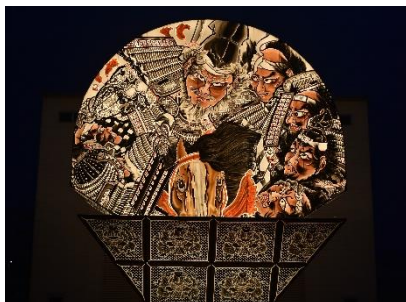
世界一の扇ねぶた