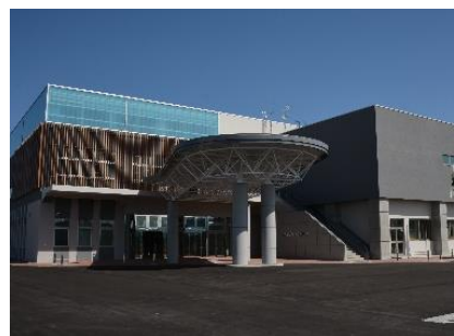
ひらかわドリームアリーナ