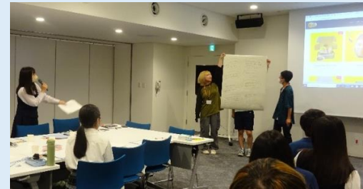
選ばれた2つのまち

各メンバーの「理想のまち」について、グループごとに発表し、多数決によって最も共感する「理想のまち」を2つ選定。選定された理想のまちをテーマに次回以降の議会を進めていきます。