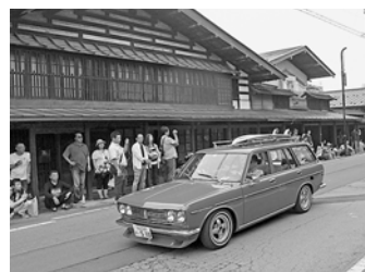
クラシックカーがこみせ通りをパレード