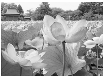
何千もの蓮の花が皆さんの来場をお待ちしています