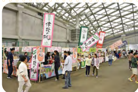
ひらかわフェスタ 2017 の様子