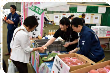
津軽の桃ご試食いかがですか！