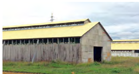
黄色いパステルカラーの屋根が特徴の鶏舎