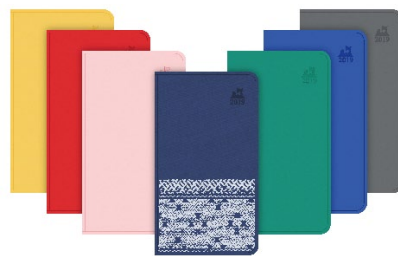
※色はイメージです

【通常版】 430 円 全 6 色 ●まぐろブラック ●さばブルー ●りんごレッド ●けまめグリーン ●だけきみイエロー ●ももピンク