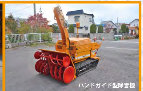
ハンドガイド型除雪機