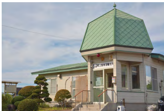
# 盛美館に似ています # 尾上警察官駐在所