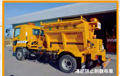
凍結防止剤散布車

道路を滑りにくくしたり、凍ってしまった雪をとかすために、凍結防止剤（塩化カルシウム、塩化ナトリウム）を散布する車両です。後方の散布装置からまんべんなく路面に散布されます。