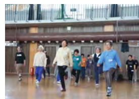
介護予防教室の様子