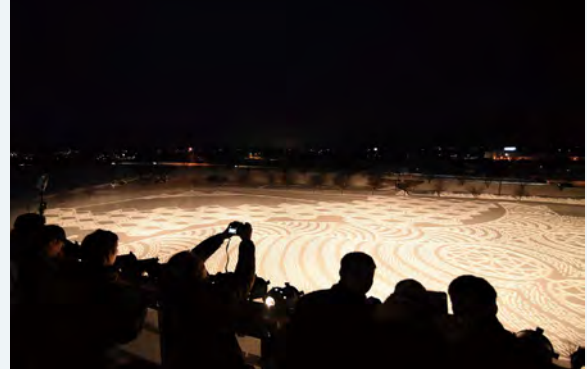
◀毎年多くの人々が鑑賞に訪れます

雪原をスノーシューで歩き、その足跡で描くスノーアート。第一人者の英国人サイモン・バックさんから技術継承を受けたスノーアーティスト集団 It's OK. の皆さんが、オリジナル図案で制作します。好評の夜間ライトアップのほか、2日目には昨年に引き続き、打ち上げ花火も実施します。