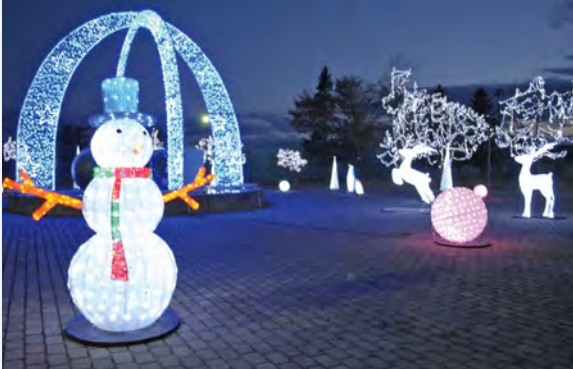
◀モニュメント広場を彩るイルミネーション

板柳町ふるさとセンターのモニュメント広場を約4万球のLEDでライトアップするほか、ツリーやアーチ、雪だるま、動物たちも登場し、「りんごの里」の冬を幻想的に演出します。