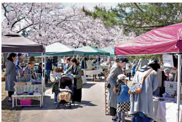
▶h&fプラス主催の「ぶらすマルシェ」