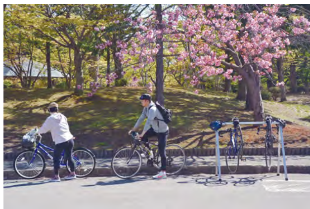
▶今回初めて行われたひらかわぐるっとライド