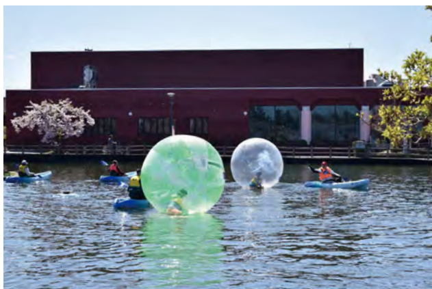
▶平川市スポーツ協会主催のウォータースポーツ体験