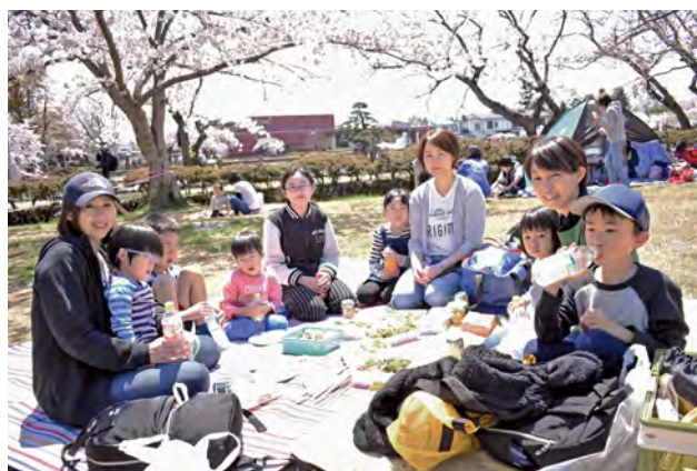
▶お弁当を持ち寄ってお花見を楽しむみなさん