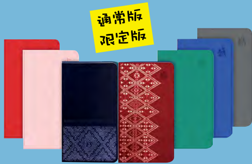
※色はイメージです。

さらに、“津軽こぎん刺し模様”と新登場の“南部菱刺し模様”の2種から選べる「限定版」も発売します。