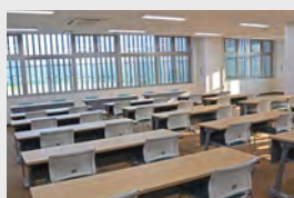
▶緊急時の消防団の待機場所