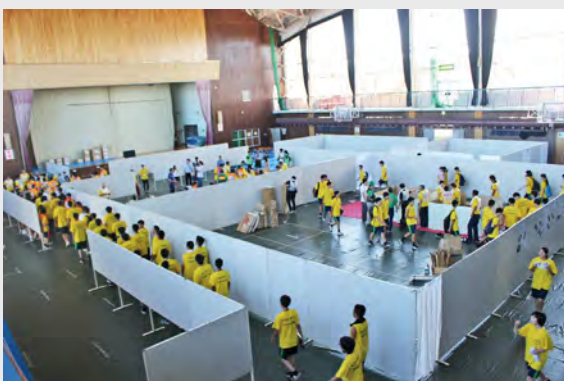
▶避難所開設時のイメージ（写真は平成30年9月平賀体育館での県総合防災訓練の様子）