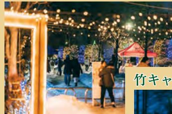
竹キャンドルエリア