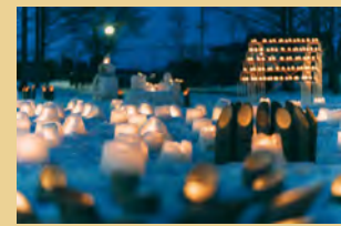
竹キャンドルエリア