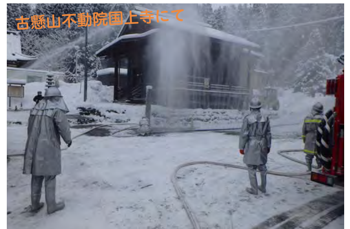
▲ 文化財火災防ぎょ訓練の様子