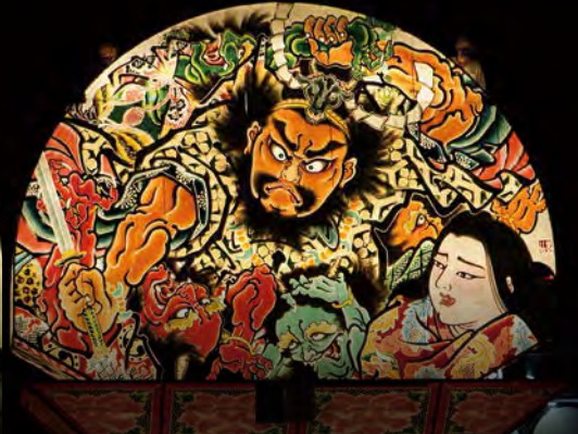
大光寺 ねぶた愛好会