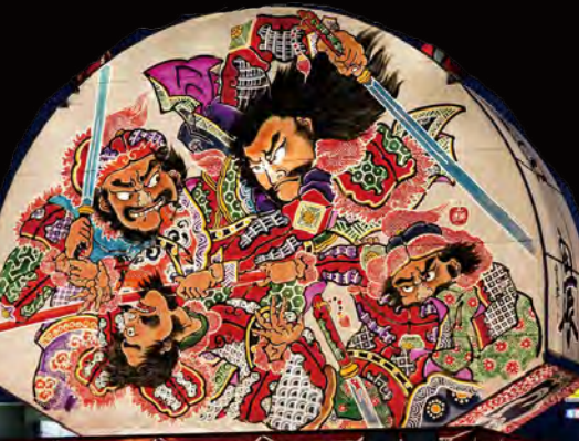
青森県立 柏木農業高等学校