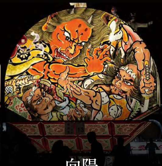
向陽 ねぶた愛好会