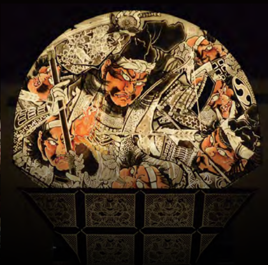
世界一の扇ねぶた 運行実行委員会