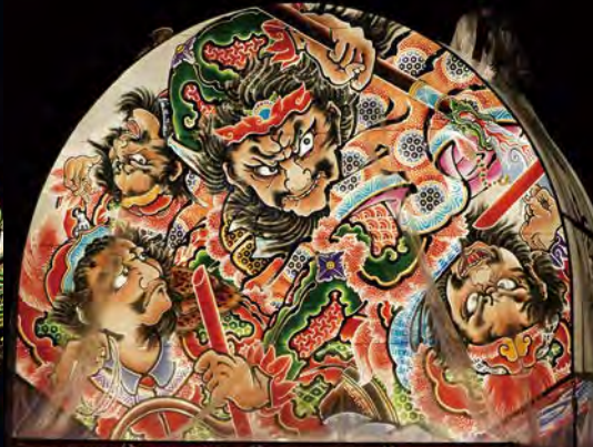
八幡崎 ねぶた同志会