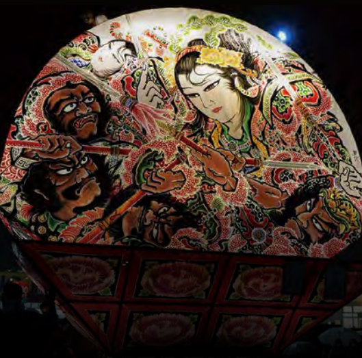
尾崎 ねぶた同心会