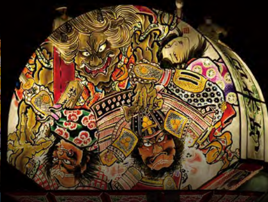
柏木町 ねぶた愛好会