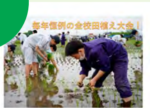
生徒たちは仲間と協力しながら、稲気あいといと苗の植え付けの正確さを競います。優勝賞品は、食品科学科が製造したりんごジュース！