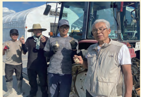
▲生産者（株）ジョイ・ワールド・パシフィックの皆さん

自分たちが育てたにんにくを食べると疲れが吹き飛んでがんばれる！平川市の子どもたちもにんにくパワーで元気に過ごしてほしい！